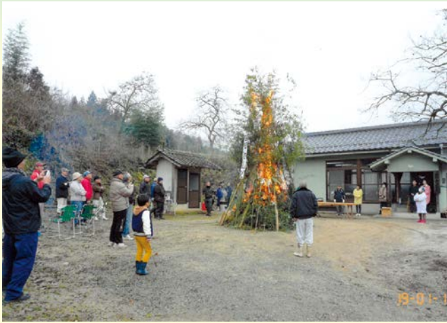
『炎に向かって無病息災を祈念』 掛田自治会