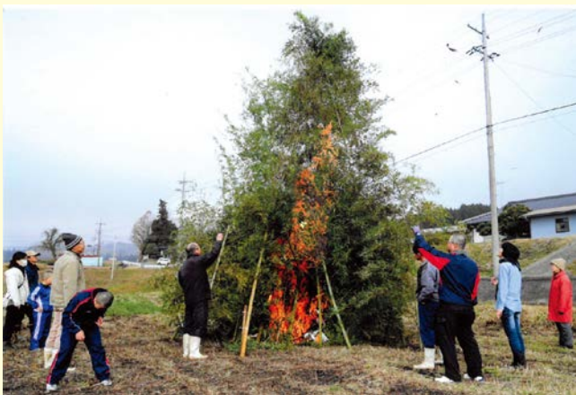
『炎が青空高く、無病息災を願う』 上原一区自治会 小深