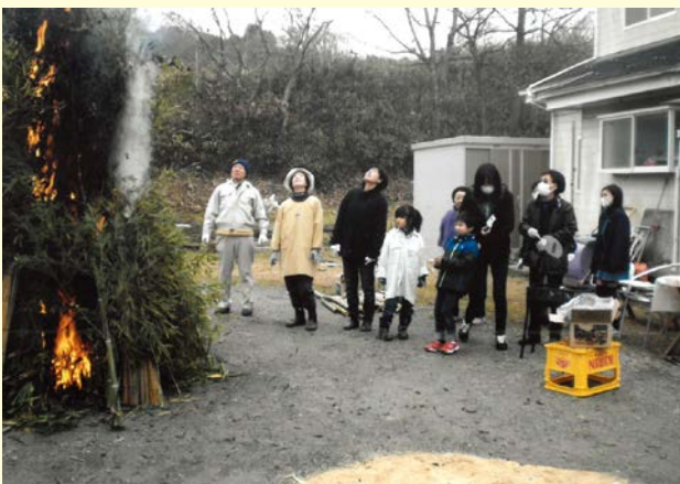
『一年間の健康を祈り』 上原南区自治会 サンハイツ上原