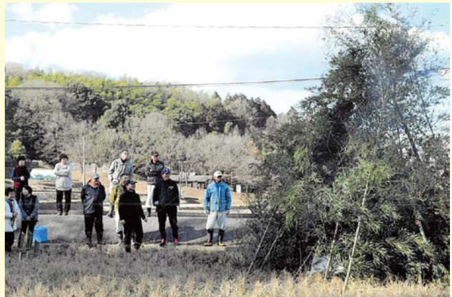
『集落の絆、炎に乗せて』 上原南区自治会 熊野