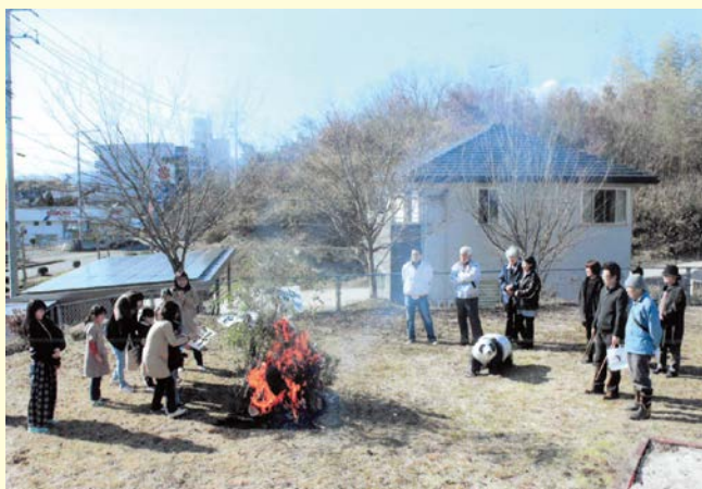
『子供の成長にエール!!』 三日市二区自治会 祇園サロン