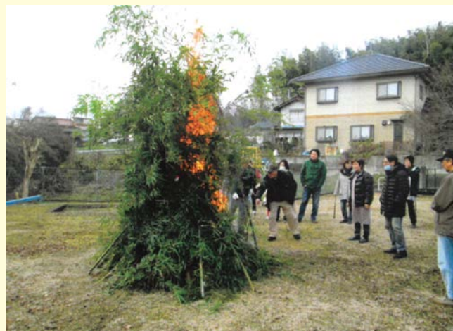
『今年もみんな仲良く』 三日市二区自治会 栄町