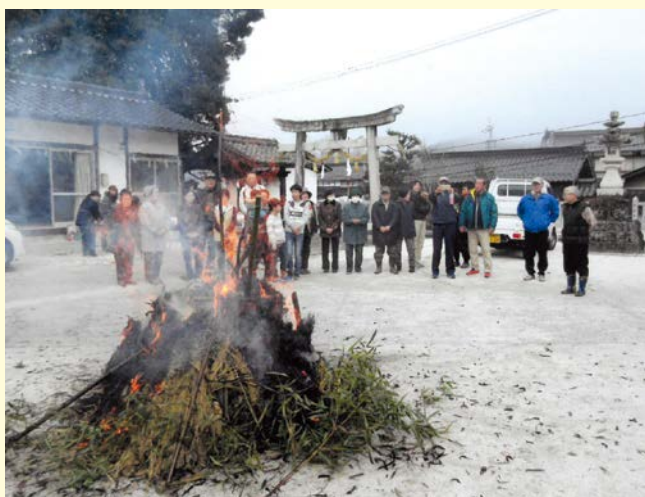
『一年の健康を願って』 三日市二区自治会 上組