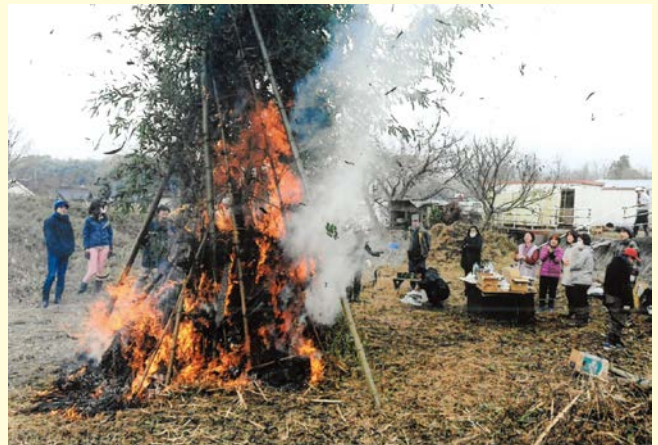
『今年も健康で過ごせますように』 上原南区自治会 高丸