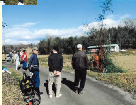
『全員の無病息災、 健康を願って』 上原一区自治会 下元組