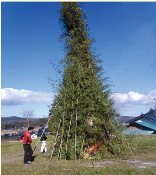
『地域の和をもっと広く!!』 七塚西自治会