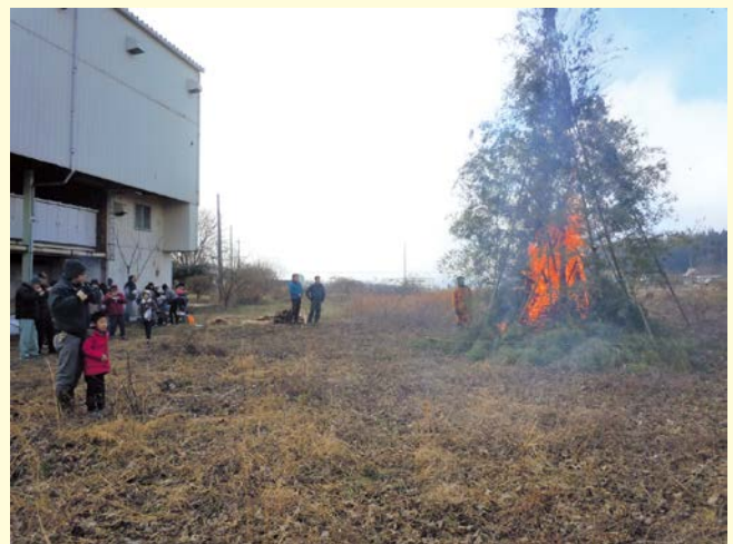
『年の差を超えて皆仲良く』 七塚東自治会