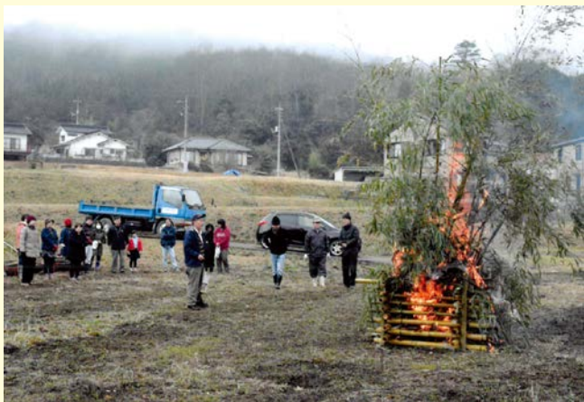
『全員で助け合い安心安全な一年を過ごす』 三日市一区自治会 北後迫