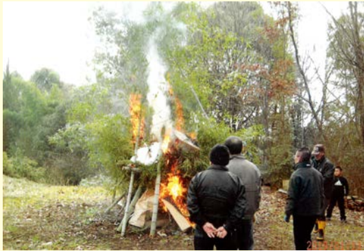
『新年の気運を願います』 市自治会 上組