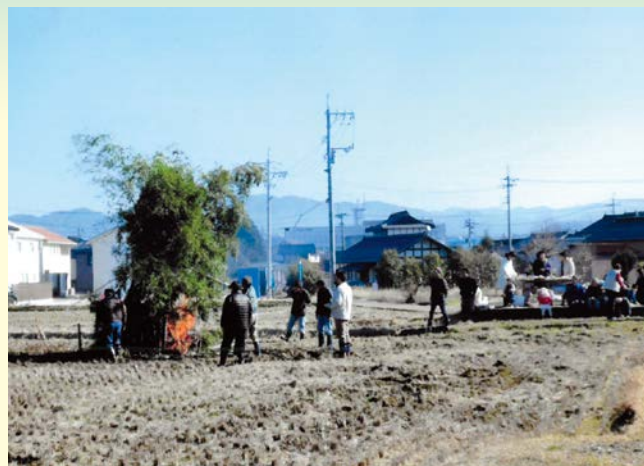
『平穏で幸せな良い年でありますように』 三日市一区自治会 南胡町 三日市二区自治会 中本町