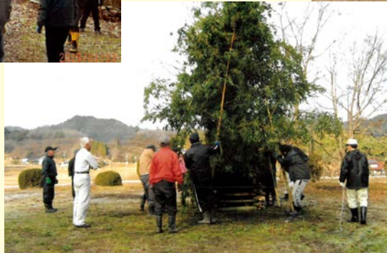
『今年一年良い年で、 元気で頑張りましょう』 市自治会 下組