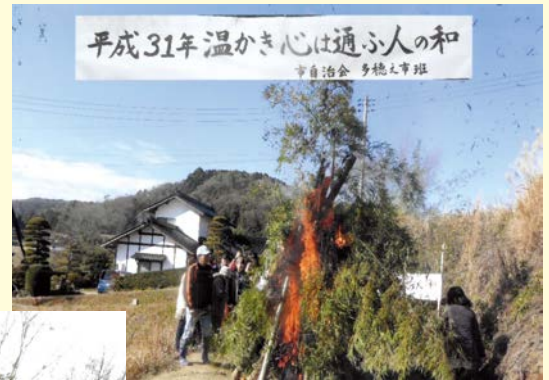
『温かき心は通ふ人の和』 市自治会 多穂の市