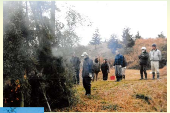
『燃えろ！今年も頑張るぞ！』 上原一区自治会 南後迫