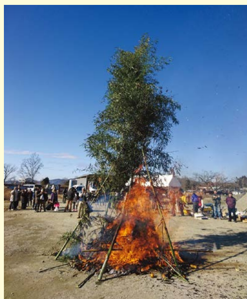
『無病息災を祈りました』 三日市三区自治会