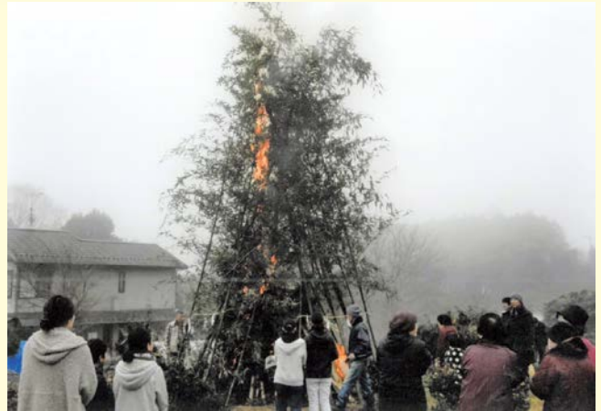
『今年も一年、健康で』 上原南区自治会 国兼