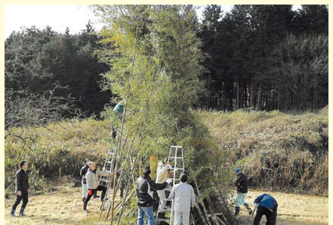
『無病息災を祈って！』 上原一区自治会 吉井