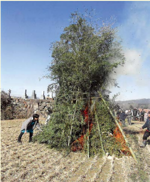
『楽しく、にぎやかに、健康で』 上原南区自治会 隠地