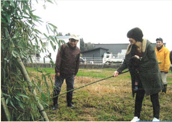
『無病息災！良い年に！』 上原一区自治会 上元組