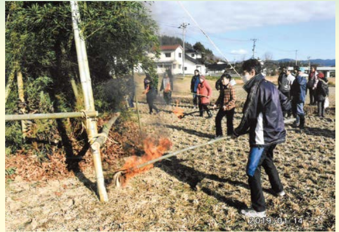
『新しい年に向い邁進』 戸郷自治会