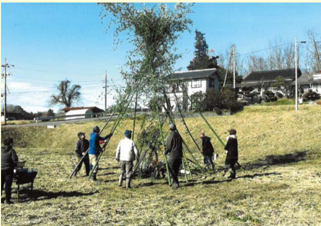
『無病息災を願って』 上原一区自治会 江木