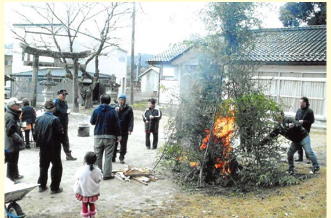
『今年も幸多い一年でありますように』 上原一区自治会 大深