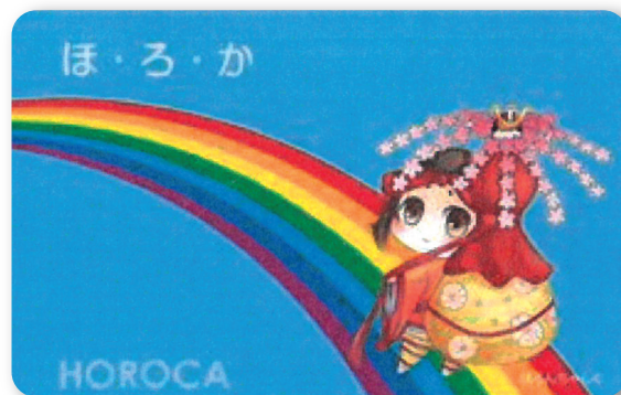
「ほ・ろ・か」デザイン