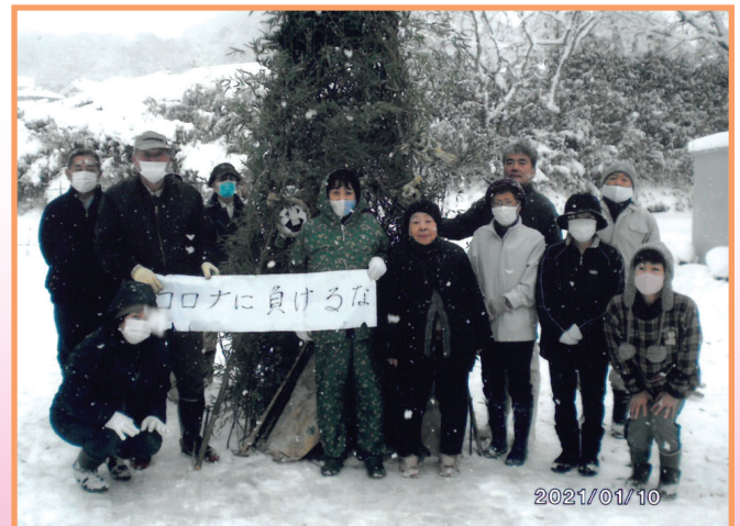
『コロナに負けるな!!』 上原南区 サンハイツ上原