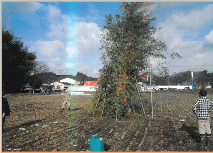
『文化の伝承と、世代間交流』 七塚東自治会