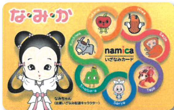
「な・み・か」デザイン