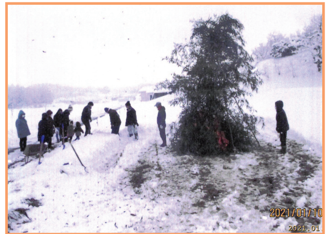
『新年の顔合わせ』 上原一区自治会 小深班