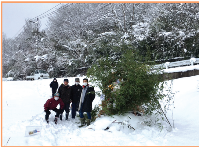
『コロナ終息とみんなの健康祈願!』 上原南区自治会 高丸班