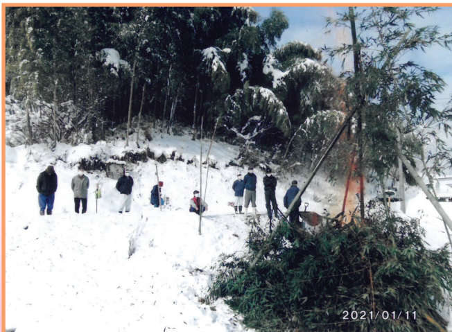
『今年もみんな健康で』 上原一区自治会 下元組