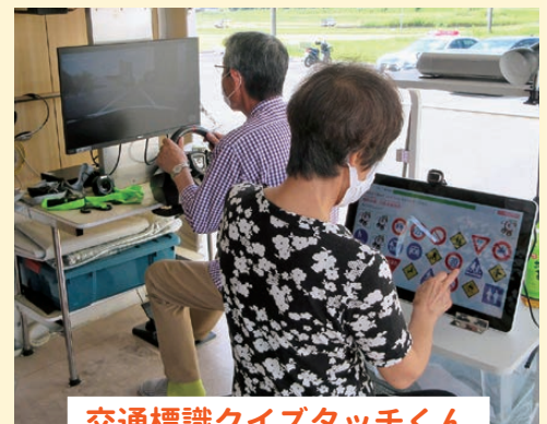
交通標識クイズタッチくん

交通安全機器の体験を通して、交通ルール・身体的機能を知って頂き交通事故防止に役立ててもらいます