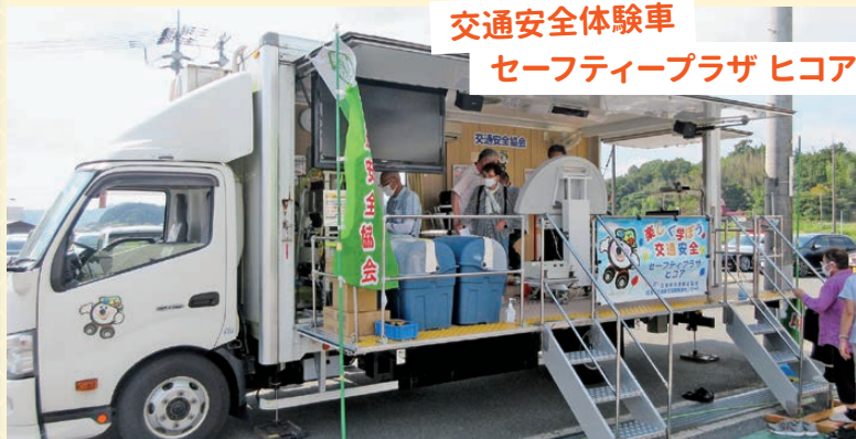
交通安全体験車 セーフティプラザ ヒコア

交通安全機器の体験を通して、交通ルール・身体的機能を知って頂き交通事故防止に役立ててもらいます