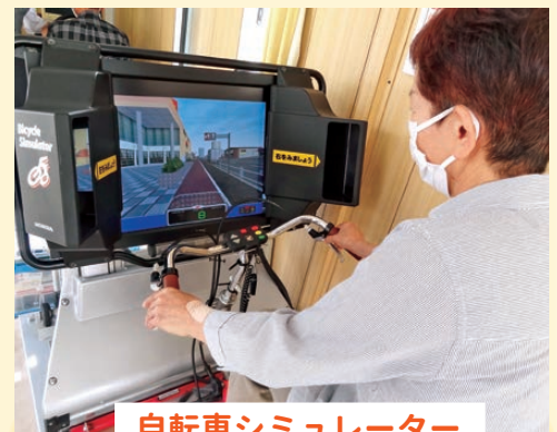
自転車シミュレーター