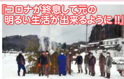
『コロナが終息して元の 明るい生活出来るように!!』