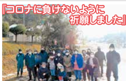
『コロナに負けないように 祈願しました!』