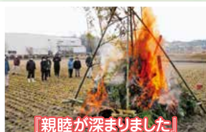
『親睦が深まりました!』