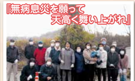
『無病息災を願って 天高く舞い上がれ!』