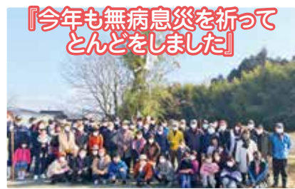
『今年も無病息災を祈って とんどをしました!』