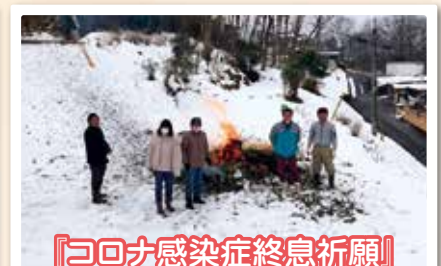
『コロナ感染症終息祈願』