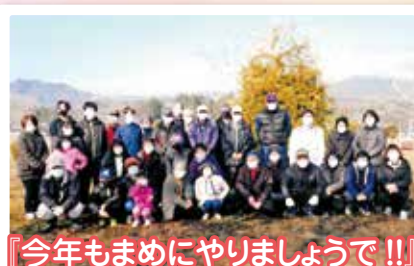
『今年もまめにやりましょうで!!』