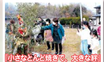
『小さなとんど焼きで、大きな絆』