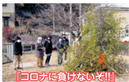
『コロナに負けないぞ!!』