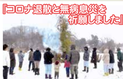
『コロナ退散と無病息災を 祈願しました!』