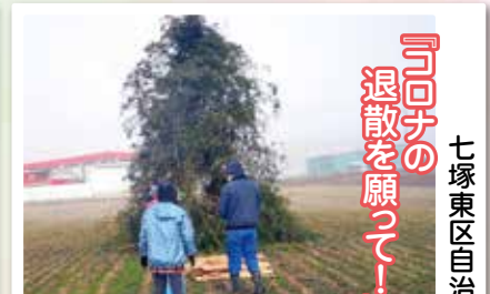
『コロナの 退散を願って!』