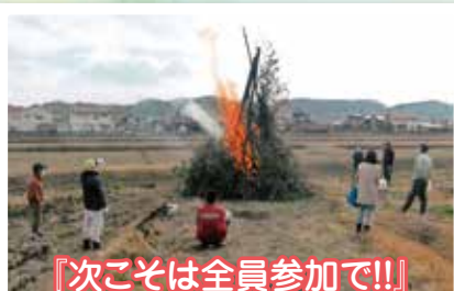
『次こそは全員参加で!!』