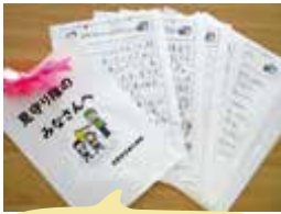
東小学校児童さんより見守り活動のお礼のお手紙をいただきました

子どもを取り巻く環境は年々激変しています。“災害は忘れたころにやってくる？”と言われるかもしれませんが、いつ何が起きるかわからない時代です。交通事故・自然災害など想定した登下校時の見守り活動や学校での声かけ運動などに取り組んでいく必要があります。最近のニュースなどでは犯罪に巻き込まれるケースも報道されています。