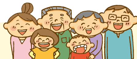
「おまかせネット東」協力者説明会