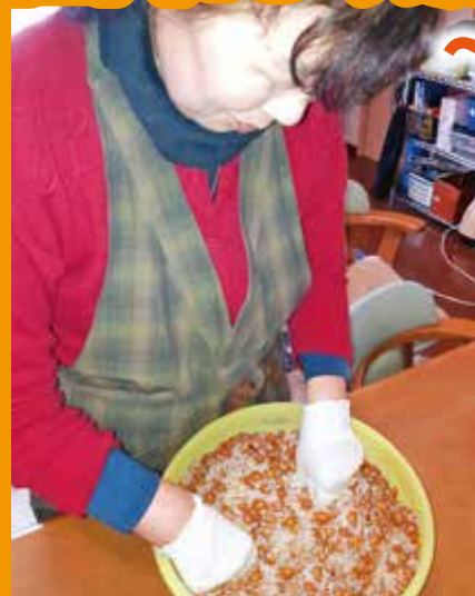
塩と麴に大豆を混ぜてしっかりつぶす