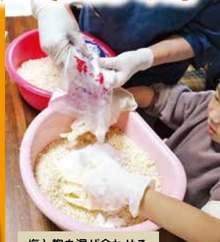
塩と麴を混ぜ合わせる