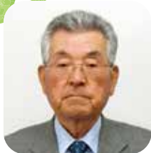
区長 田邊 良三